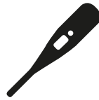
Verhoging of koorts