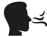
Reuk- en/of smaak- verlies

Heb je op dit moment een huisgenoot met milde klachten en koorts en/of benauwdheid?